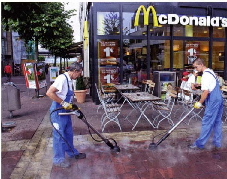
Die Entfernung von Kaugummi-Flecken ist personalintensiv und teuer.

Und das liegt sicher auch daran, dass die Gewerbetreibenden in das Konzept einbezogen wurden, allen voran zwei bekannte Franchisebetriebe aus dem Nahrungsmittel-