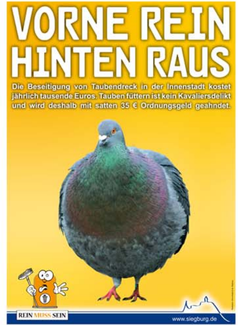
Tauben füttern ist vielerorts verboten – und wird doch ignoriert.

meine Steigerung der Sauberkeit im urbanen Raum den ‚Nerv der Zeit‘ trifft und nachhaltig erfolgreich zu wirken scheint, zeigt nicht nur das große Interesse vieler bundesdeutscher Städte, die die Plakate bei sich aufstellen wollen und daher in Siegburg angefragt haben. Der Ruf der Aktion geht mittlerweile auch über Deutschland hinaus, hat geradezu weltweite Dimension angenommen. Zahlreiche ausländische Besucher waren bei ihrem Besuch in Siegburg von der Wirkung der Plakate scheinbar derart beeindruckt, dass sie darum ersuchten, eines mit in ihre Heimat nehmen zu können. So findet man die „Siegburger Plakate“ unter anderem bereits in Hongkong,