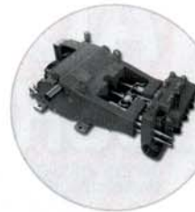
185 ARP® Hochdruck Plungerpumpe