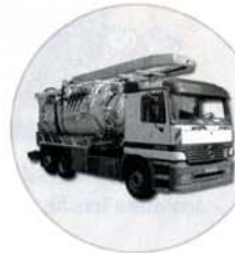
Systeme z.B. LKW Aufbauten

WOMA Apparatebau GmbH Werthauer Str. 77-79 | D - 47226 Duisburg Tel.: +49 2065 304-0 | Fax: +49 2065 304-200