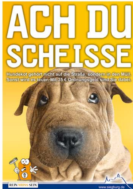
Üble Hinterlassenschaften von Hunden verlangen nach einer drastischen Sprache, meint man im Siegburger Rathaus.

Dass die dreiteilige Plakataktion nicht nur in Siegburg im Hinblick auf eine allge-